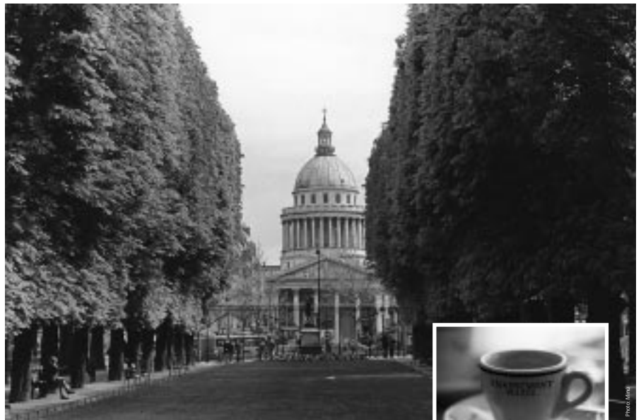
Design: Job, Herrenberg

In unserem nächsten Economix beschäftigen wir uns mit dem Thema » Erben und Schenken «. In loser Folge wollen wir Ihnen einen kleinen Ratgeber über dieses Thema zusammenstellen. Außerdem wollen wir Ihnen Möglichkeiten der betrieblichen Altersvorsorge vorstellen und auf Änderungen der gesetzlichen Grundlagen hinweisen.